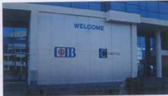
البنك التجاري الدولي يمول شركة النيل للتفريغ بمبلغ 86 مليون جنيه