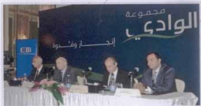
كتب - أحمد محمد علي الأحد 25 أكتوبر 2011 09:45