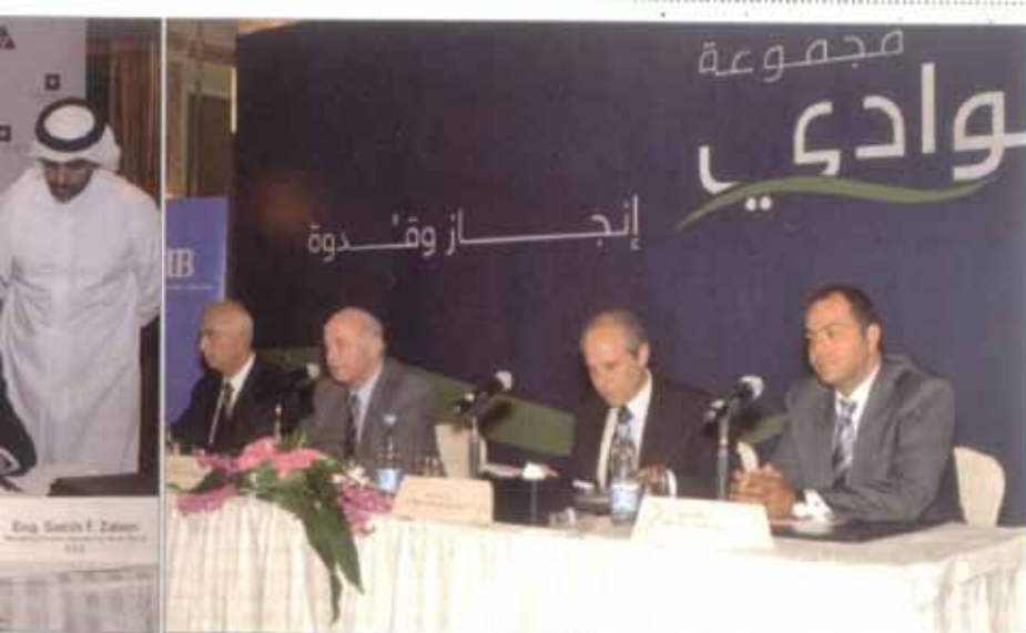
مجموعة الوادي وميد سوفتس أثناء توقيع الاتفاقية لتمويل إنشاء شركة النيل